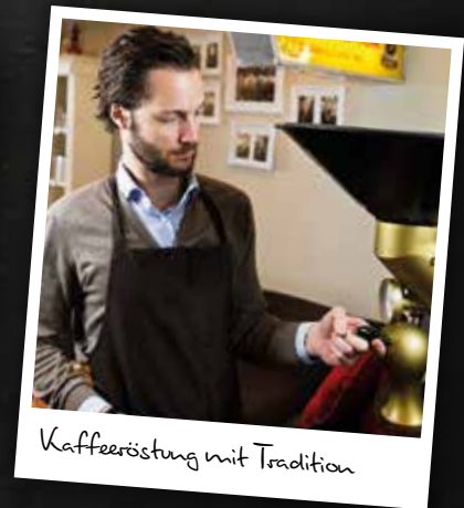
Kaffeeröstung mit Tradition

Ganz behutsam bei niedrigen Temperaturen, langen Röstzeiten und kleinen Chargen, bringen wir unsere über 130-jährige Erfahrung ein, um jeder einzelnen Kaffeebohne ihr optimales Aromenspektrum zu entlocken, denn seit 1883 bis heute gilt bei Machwitz Kaffee: Jede Tasse Extraklasse!