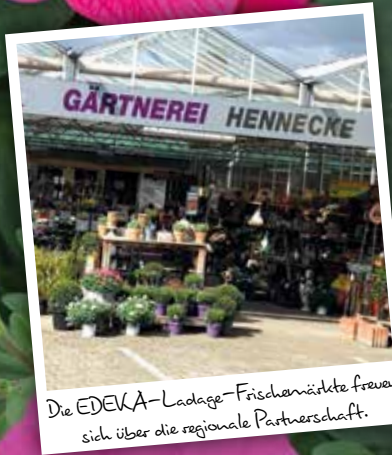
Die EDEKA-Ladage-Frischmärkte freuen sich über die regionale Partnerschaft.

Große Auswahl an saisonalen Produkten, Schnittblumen aber auch Grün- und Blühpflanzen für Haus, Wohnung, Garten und Balkon.