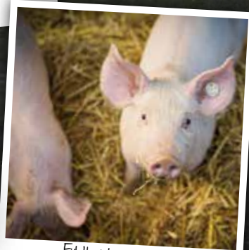
Fühlt sich sauuwohl ... Violkas Heide-Stroh-Schwein