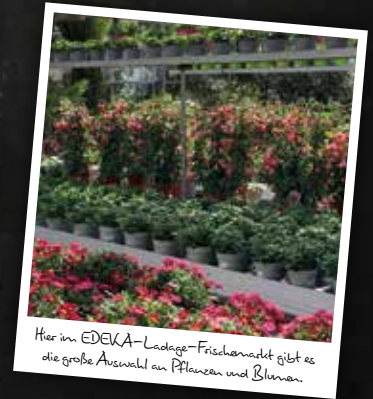
Hier im EDEKA-Ladage-Frischmarkt gibt es die große Auswahl an Pflanzen und Blumen.